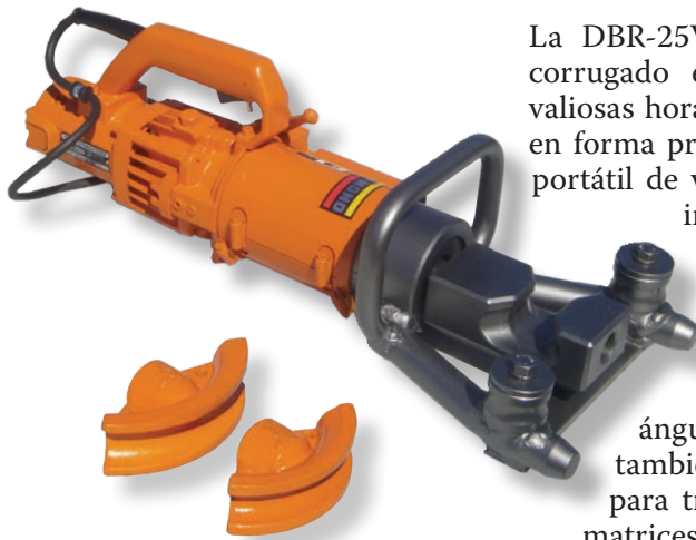
Juego de matrices para plegado pequeñas y grandes

La DBR-25WH es una dobladora y enderezadora de varillas de acero corrugado electro-hidráulica portátil para trabajo pesado. Permite ahorrar valiosas horas hombre, ya que dobla y endereza varillas de acero corrugado en forma prolija y efectiva. Funciona como una simple dobladora eléctrica portátil de varillas de acero corrugado a 90 grados. El gancho de plegado intercambiable cubre varillas de acero corrugado grado 60 de #4 a #8 de diámetro. La presión máxima de plegado y enderezamiento varía entre 8,5 y 11 toneladas. Es portátil y suficientemente versátil como para doblar y enderezar varillas de acero corrugado en donde se encuentre gracias a sus capacidades hidráulicas de empujar y tirar. Pliega ángulos de 90 grados en sólo cuatro segundos. El cabezal para plegado también rota 360 grados. Se entrega completa, en estuche de madera para transporte, con aceite hidráulico, un kit de herramientas y dos matrices adicionales para plegado. Sirve para trabajos de plegado imposibles de realizar con otras herramientas.