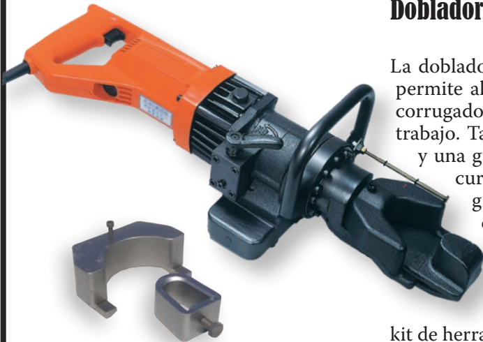
Juego de collarín y zapata de 90 grados

La dobladora eléctrica/hidráulica portátil HB-16W para trabajo pesado permite ahorrar valiosas horas hombre, ya que dobla varillas de acero corrugado grado 60 de hasta 5/8" (#5) de 0 a 135 grados en el lugar de trabajo. También cuenta con un motor eléctrico con doble aislamiento y una guía de plegado desmontable para repetir el mismo ángulo de curvatura. El juego de zapata y collarín estándar para plegado a 90 grados facilita la repetición de plegados a 90 grados sin guía. El collarín desmontable para plegado aumenta el radio de curvatura y minimiza el quebrantamiento de las varillas de acero corrugado, especialmente las de grado 60 #5. Esta dobladora electro-hidráulica portátil se entrega completa en estuche de acero para transporte, con aceite hidráulico y un kit de herramientas. Sirve para trabajos de plegado imposibles de realizar con otras herramientas.